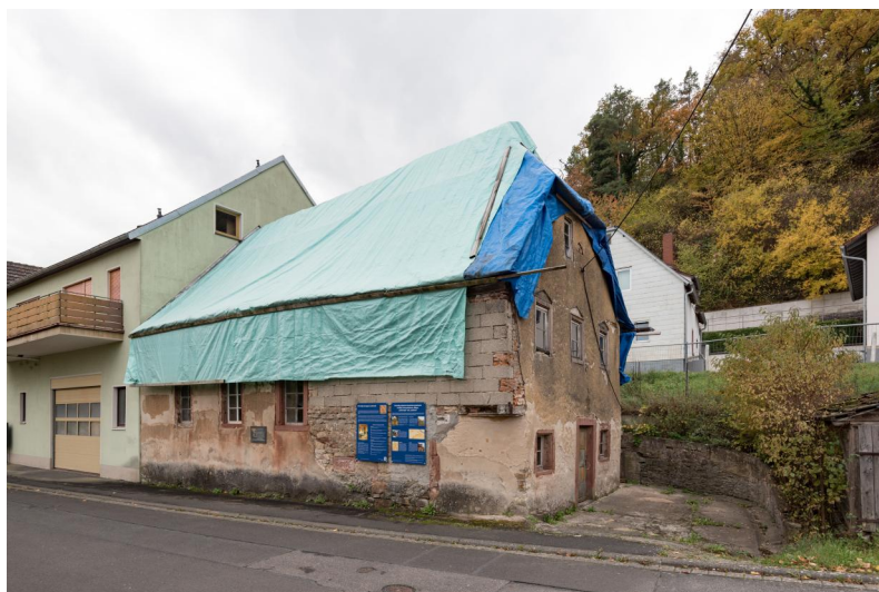
Laudenbach, Mühlbacher Straße / Ecke Bandwöhrstraße. Eineinhalbgeschossiger Halbwalmdachbau mit Tonnenwölbung, verputzter Bruchsteinbau mit Sandsteinrahmungen, Chuppastein und Sandstein-Türrahmung mit hebräischer Inschrift sowie Spuren der Mesusa, 1736, 1938 verwüstet, danach teilweise verändert (Aufnahme 2018). Copyright Wikimedia Commons / Tilman2007

1667 wird in den Akten erstmals eine "Schuell zue Laudenbach", d.h. eine Synagoge, erwähnt, in der Juden aus Laudenbach, aus Karlburg , Karlstadt und Mühlbach zusammen mit einem Vorsänger Gottesdienst feierten. Anfang der 1730er Jahre war dieses jüdische Gotteshaus baufällig. Das neue Gebäude sollte auf dem Grundstück der "Alten Schul" verbleiben (Haus-Nr. 14, heute: Mühlbacher Straße 6). Ein größerer, aufwendiger Massivbau ersetzte ab 1737 das alte Haus. Im Erdgeschoss befanden sich die Männer- und Frauensynagogen sowie weitere Räume, darunter wohl auch ein Schulzimmer; im ersten Obergeschoss war die Wohnung des Lehrers. An der nordwestlichen Längsseite der Synagoge befinden sich auf den Basissteinen unterhalb des Chuppasteins Schriftzeichen, die bisher nicht entziffert werden konnten.