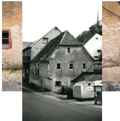
Laudenbach, Mühlbacher Straße / Ecke Bandwöhrstraße, Spolie eines gemauerten Aron ha-Kodesch in der Außenmauer der ehem. Synagoge (Aufnahme 2013).