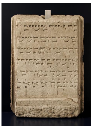
Jüdischer Grabstein im LANDSHUTmuseum, wohl 14. Jahrhundert. Ursprünglich im Innenhof des ehem. Franziskanerklosters angebracht, jetzt im Depot (Aufnahme 2006).