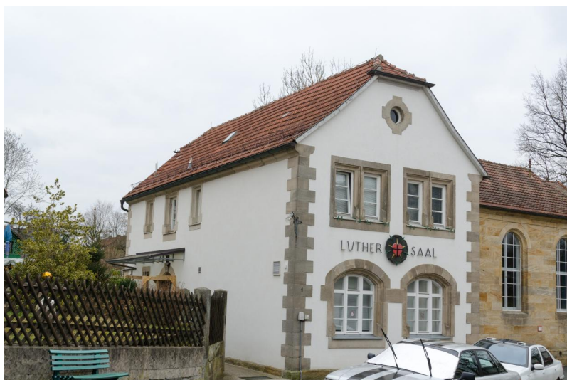
Am rechten Rand des Bildes die Turnhalle, die nach 1900 auf dem Grundstück der ehemaligen Synagoge errichtet wurde.

Von einer 1694 erwähnten Synagoge fehlt bislang jede Spur. Die Größe der Gemeinde zu dieser Zeit macht zwar die Existenz wahrscheinlich. Wahrscheinlich ist sie der Vorgängerbau des Neubaus von 1796. Der 1796 aus Stein errichtete Neubau trug die alte Hausnummer 100 (heute: Am Hirtengraben 1). Das Gebäude ist in den Bayerischen Denkmal-Atlas aufgenommen. Ursprünglich war es ein zweistöckiger Sandsteinbau mit einem Walmdach. Im Südteil des Erdgeschoßes lag die Rabbinerwohnung, während sich im Obergeschoß der Synagogenraum befand.