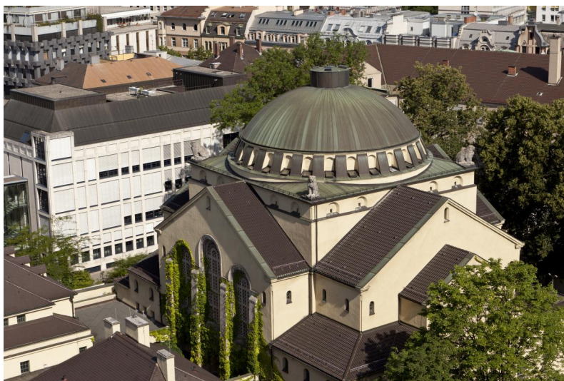
Synagoge Augsburg, 2010.

Erstmals wird eine Synagoge in Augsburg im Stadtrecht aus dem Jahr 1276 genannt. Man darf jedoch davon ausgehen, dass sie schon früher vorhanden war. Ihr genauer Standort wird bei der ehemaligen Kapelle St. Leonhard (heute: Karlstraße 21) vermutet. 1290 hat man in ihrer Nachbarschaft ein Tanzhaus für Hochzeitsfeste errichtet. Nach der Ausweisung aller Juden aus der Stadt ab 1448 wurden beide Gebäude beschlagnahmt und zu Wohnhäusern umgebaut. Anfang der 1740er Jahre hatten sich die Juden in Augsburg wieder soweit angesiedelt, dass sie Versammlungen und Gottesdienste abhalten konnten. 1742/43 kam es zur "Abschaffung der jüdischen Laubhütten". Auf eine "neu aufgerichtete Judenschul" und "andere Zusammenkünfte der hiesigen Judenschaft" reagierte der Stadtrat mit der Ausweisung aller Juden im Mai 1745.