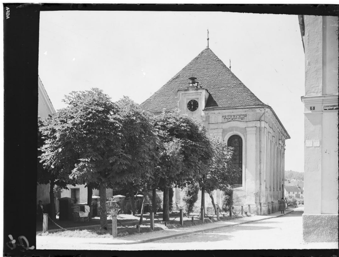
Synagoge Krumbach, Fotografie ca. 1910.

Wahrscheinlich traf sich die jüdische Gemeinschaft von Hürben anfangs in einem oder mehreren Privathäusern zum Gebet. Graf Maximilian von Lichtenstein zu Krumbach genehmigte 1675 den Bau eines jüdischen Gotteshauses mit einem Nebenhaus, in dem der Rabbiner und der Vorsänger wohnten. Dafür war eine jährliche Steuer von sechs Gulden zu entrichten. Die Gebäude wurden auf einem zuvor von Isack Welsch erworbenen Grundstück in der Gemeindegasse (heute: Synagogengasse) errichtet. Bei dem Sakralbau handelte es sich laut einer kurzen Beschreibung aus dem Jahr 1759 um einen eingeschossigen Backsteinbau mit "einer Art von Kirchenfenstern".