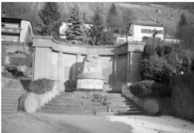
Klingenberg am Main, Kommunales Kriegerdenkmal (Aufnahme Israel Schwierz, 1996). Copyright BayHStA, BS N 80 80/20-16A

In Klingenberg am Main gibt es auf dem Friedhof der Stadt in der Wilhelmstraße, oberhalb des Haupteinganges, ein großes Kriegerdenkmal für die Gefallenen beider Weltkriege.