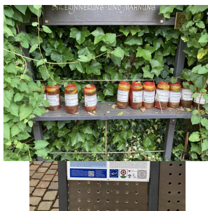
Klingenberg, Synagogenplatz mit Mahnmal und Gedenkstätte (Aufnahme 2023).