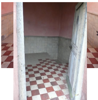
Kleinheubach, ehem. Mikwe am Fischgässchen (Aufnahme 2023).