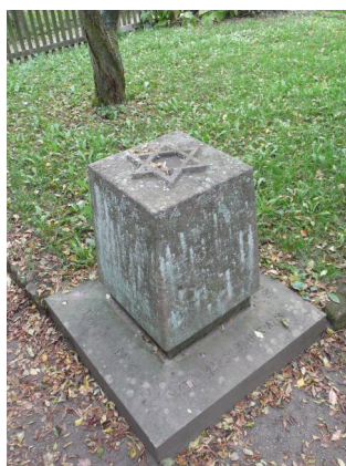
Gedenkstein vor der ehem. Mikwe (Aufnahme 2011)