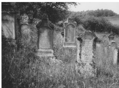
Jüdischer Friedhof Aufseß.