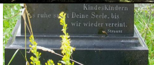
Jüdischer Friedhof Aufseß, 2022.