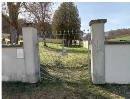
Jüdischer Friedhof Aufseß, 2022.