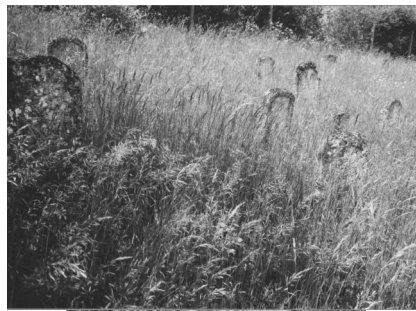
Jüdischer Friedhof Aufseß.