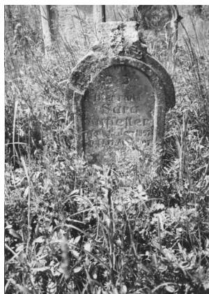
Jüdischer Friedhof Aufseß.