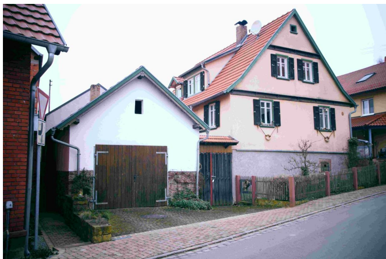
Wiesenfeld, Kirchberg 3, ehem. jüdisches Schulhaus und einstige Mikwe als Garage (Aufnahme 2015).