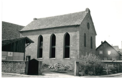
Das Gebäude der ehemaligen Synagoge in Wiesenfeld um 1987.