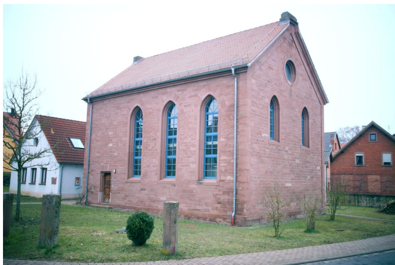
Die ehemalige Synagoge Wiesenfeld nach Abschluss der Restaurierungen 1993.

Aus einem Bericht des Hutten'schen Patrimonialgerichts Steinbach an die Kreisregierung in Würzburg im Jahr 1817 geht hervor, dass es bereits um 1717 eine "Judenschul" in Wiesenfeld gab. Sie war um 1787 zu klein geworden und wurde dann durch eine freistehende Synagoge ersetzt. Die Kultusgemeinde errichtete sie mit Erlaubnis der Freiherrn von Hutten auf einem der herrschaftlichen Grundstücke im Nordosten des Ortes und musste für ihre Nutzung jährlich einen Grundzins bezahlen.