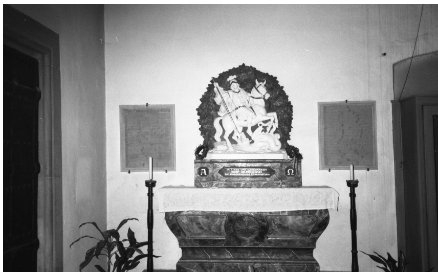
Karlstadt, Kriegerdenkmal in der Pfarrkirche St. Andreas (Aufnahme Israel Schwierz, 1996). Copyright BayHStA, BS N 80 80/74-15A

In Karlstadt befindet sich das Denkmal für die Gefallenen des Ersten Weltkrieges in der rechten Seitenkapelle der Stadtpfarrkirche St. Andreas. Die Mitte der altarähnlichen Gedenkstätte nimmt eine Skulptur des Drachentöters St. Georg ein. Die Widmung lautet: IN LIEBE UND DANKBARKEIT IHREN HELDENSÖHNEN DIE STADTGEMEINDE KARLSTADT 1924.