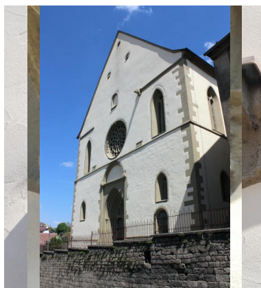
Aub, Pfarrkirche Maria Himmelfahrt, Judenfeindlicher Wasserspeier aus der 2. Hälfte des 13. Jahrhunderts an der Westfassade (Aufnahme 2022).