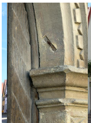
Aub, Marktplatz 19, ehem. Anwesen der Familie Kannenmacher, links Schaufenster des Schuh- und Hutgeschäfts von Regina Rosenfeld (Aufnahme 2022).