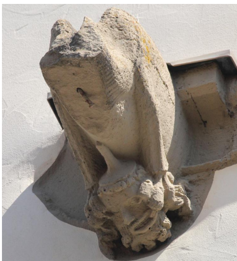
Aub, Pfarrkirche Maria Himmelfahrt, Judenfeindlicher Wasserspeier aus der 2. Hälfte des 13. Jahrhunderts an der Westfassade (Aufnahme 2022).

Da Aub am Schnittpunkt der beiden Fernhandelswege von Italien in den Norden und von Nürnberg nach Frankfurt und in die Niederlande lag, entwickelte sich hier im Mittelalter rasch eine größere Siedlung. Der Ort bot dafür mit seiner verkehrsgünstigen Lage gute Voraussetzungen. Der erste Hinweis auf ihre Anwesenheit findet sich im Martyrologium des Nürnberger Memorbuch, das in der Rintfleisch-Verfolgung 1298 auch Opfer aus Aub verzeichnet. 1327 nennen Gerichtsakten in Nürnberg und 1333 in Köln jeweils einen Juden, der aus Aub stammte. Die wohl nur kleine jüdische Gemeinde wurde in der Armleder-Verfolgung in Franken 1336 ausgelöscht.