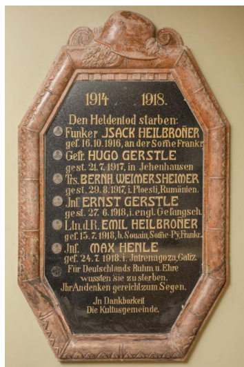
Gedenktafel in der ehemaligen Synagoge Ichenhausen für die im Ersten Weltkrieg gefallenen jüdischen Einwohner Ichenhausens.

In Ichenhausen gibt es im Eingangsbereich der ehemaligen Synagoge und auf dem Ortsfriedhof insgesamt drei Gedenktafeln für die jüdischen Gefallenen des Ortes, außerdem erinnern die Inschriften von drei Gräbern auf dem jüdischen Friedhof an gefallene Kriegsteilnehmer.