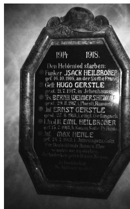
Ichenhausen, Gedenktafel für die gefallenen jüdischen Gemeindemitglieder in der ehem. Synagoge (Aufnahme Israel Schwierz, 1996). Copyright BayHStA, BS N 80 80/67-05A