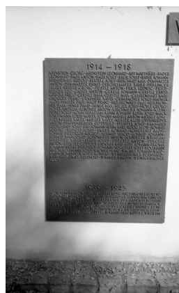
Ichenhausen, Kriegerdenkmal auf dem Ortsfriedhof, Detailansicht mit Namenstafel 1914-18 (Aufnahme Israel Schwierz, 1996). Copyright BayHStA, BS N 80 80/71-05