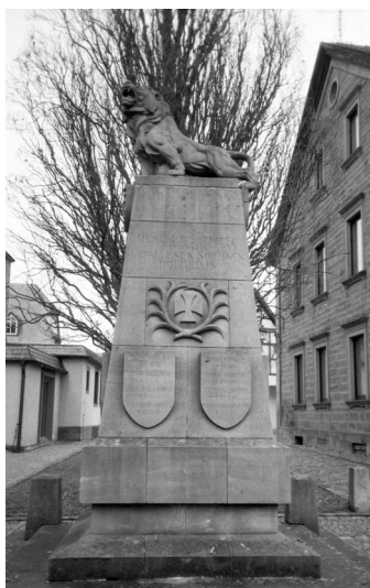
Hofheim, Kriegerdenkmal der Gefallenen des Ersten Weltkriegs (Aufnahme Israel Schwierz, 1996). Copyright BayHStA, BS N 80 80/110-000

In Hofheim befindet sich auf dem Marktplatz neben der kath. Stadtpfarrkirche St. Johannes der Täufer ein Kriegerdenkmal für die Gefallenen von 1914-18, mit einem großen liegenden bayerischen Löwen an der Spitze. Unter der Überschrift DEN IM WELTKRIEG 1914 – 1918 GEFALLENEN SOEHNEN HOFHEIMS auf der Vorderseite kann man auf Schildern an den vier Seiten des Denkmals auch die Namen jüdischer Kriegstoter: