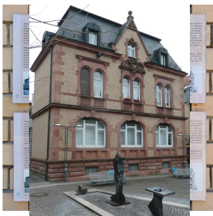
Aschaffenburg, Mahnmal auf dem Wolfsthal-Platz, dem ehemaligen Standort der Synagoge neben dem erhaltenen Rabinatsgebäude (Aufnahme 2025).