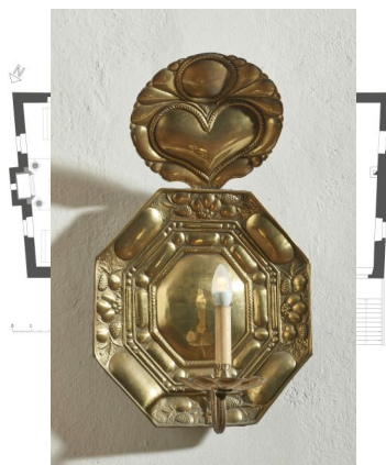
Höchberg, Grundriss der Synagoge. Rekonstruktionsskizze nach den Notizen Theodor Harburgers von 1930 und dem Aufmaß von 1970, Zustand nach dem Umbau der Frauensynagoge von 1855 mit Mikwe von 1908. Copyright Cornelia Berger-Dittscheid, Maxhütte-Haidhof