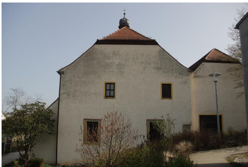
Ehemalige Synagoge Höchberg, Sonnemannstr. 36, jetzt ev.-luth. Pfarrkirche.