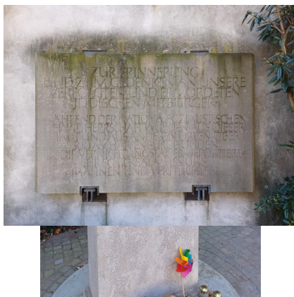
Aschaffenburg, Mahnmal auf dem Wolfsthal-Platz, dem ehemaligen Standort der Synagoge neben dem erhaltenen Rabbinatsgebäude (Aufnahme 2025).