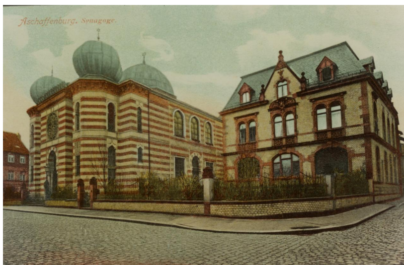
Die Neue Synagoge Aschaffenburg, erbaut bis 1893. Postkarte (Chromo-Heliogravüre) um 1910.

Erstmals wird 1267/68 im Totenbuch des Aschaffener St. Peter und Alexander eine jüdische "Schule" erwähnt, die sich in einem verpachteten Haus an der damaligen Hauptstraße befand (heute Dalbergstraße 35, Ecke Rathausgasse). Zwischen 1344 und 1437 wird dieses Gotteshaus mehrmals erwähnt. Als es 1429 im Erzstift Mainz zu antijüdischen Pogromen kam, wurde wohl auch die Aschaffener Synagoge beschädigt. Obwohl sie 1459 schon völlig verfallen war, wurde weiterhin eine jährliche Pacht verlangt. Nach 1464 entstand auf dem Grundstück eine christliche Sattlerei, aber jahrhundertlang hielt sich noch der Hausname "Zur Judenschul". Einige Reste der Bausubstanz sind im heutigen Gebäude erhalten geblieben.