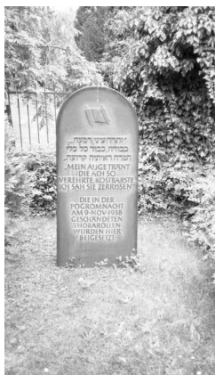
Aschaffenburg, Mahnmal an das Novembepogrom im jüdischen Friedhof. Das Denkmal hat die Form eines Grabsteins und steht an der Stelle, wo die geschändeten Thorarollen rituell beigesetzt wurden (Aufnahme Israel Schwier, 1996). Copyright BayHStA, BS N 80 80/32-32a