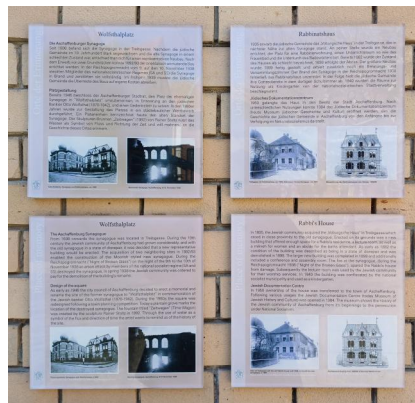
Die Synagoge in Aschaffenburg und das alte Rabbinatsgebäude, 1887