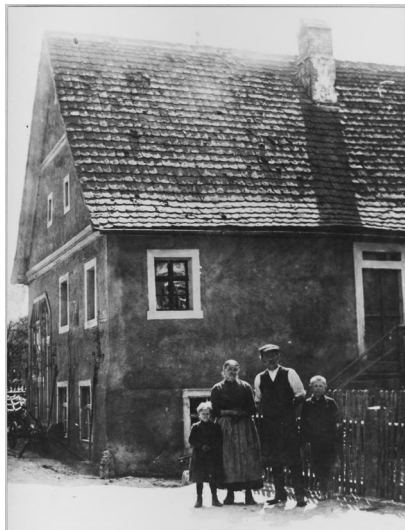
Heiligenstadt, jüdisches Privathaus mit Synagoge im Obergeschoss (Aufnahme Ende 19. Jahrhundert).