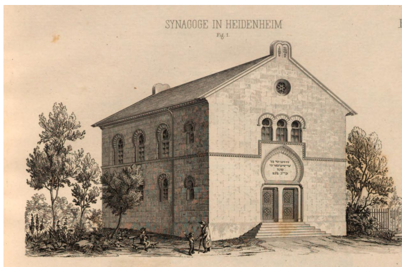
Die Synagoge Heidenheim nach dem Entwurf von Eduard Bürklein, publiziert in der Allgemeinen Bauzeitung 1854.

Im Jahre 1736/37 wurde südlich des ehemaligen Klostermeierhofs eine Synagoge gebaut (Haus Nr. 15 1/2 ). Von diesem ersten Gotteshaus sind keine Ansichten oder Pläne erhalten. In der Nacht auf den 31. März 1851 brach in einem Ziegenstall nahe der Synagoge ein Feuer aus. Die Flammen erfassten das Gotteshaus und richteten irreparable Schäden an. Bereits einen Monat später reichte das Landgericht Heidenheim bei der mittelfränkischen Regierung die Pläne für einen Neubau ein: Der Standort blieb derselbe, die ersten Pläne sahen jedoch eine neugotische Architektur vor, was wegen seiner zu großen Ähnlichkeit mit christlichen Kirchen abgelehnt wurde.