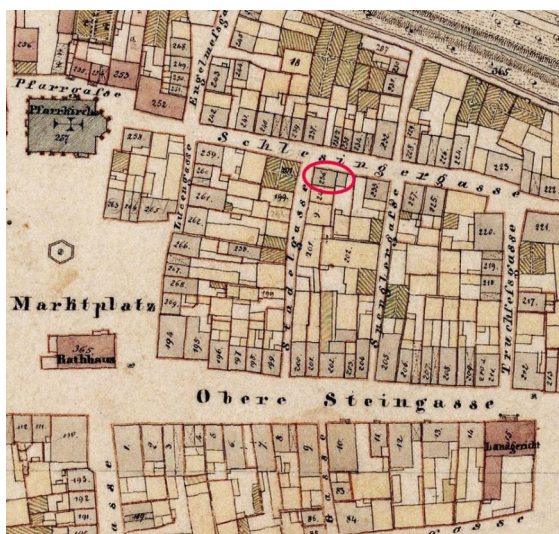
Haßfurt, Uraufnahme 1808-1864 (Ausschnitt). Die Synagoge ist im roten Kreis markiert.