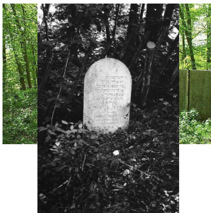
Jüdischer Friedhof Steinhart.