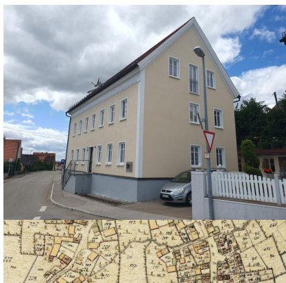
Hainsfarth, Jurastraße, Ensemble des ehem. jüdischen Gemeindezentrums mit Schule (Nr. 12), Synagoge (Nr. 10) und Mikwe-Denkmal (Aufnahme 2023).