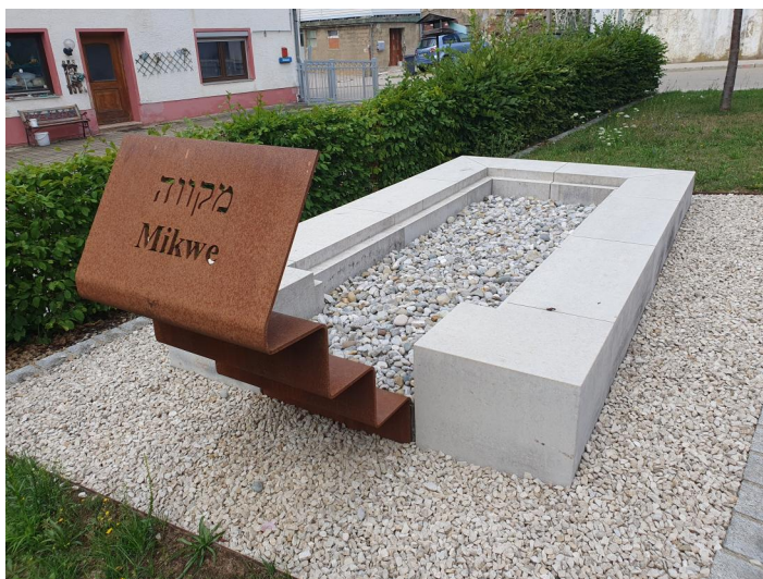
Hainsfarth, Denkmal auf den Grundmauern der Mikwe vor der ehem. Synagoge (Aufnahme 2023)