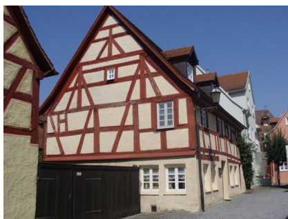
Gunzenhausen, Brunnenstraße 10, ehem. jüdisches Wohnhaus erb. 1736 mit Informationstafel der früheren Eigentümer (Aufnahme 2023).