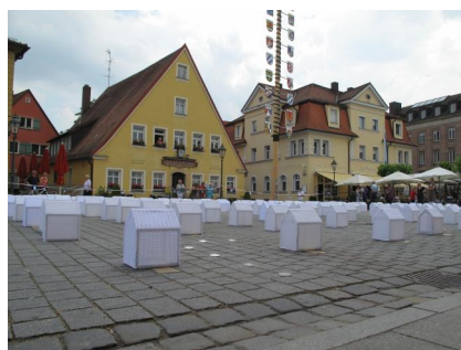
Gunzenhausen, Marktplatz mit der Kunstinstallation von Stephanie Rhode (Aufnahme 2011).