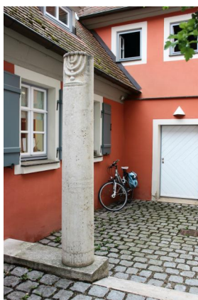
Gunzenhausen, Hafnermarkt 13, jüdisches Wohnhaus erb. 1753 von Kappel Samson, später Schächterhaus mit Mikwe von 1883, jetzt Kreisverkehrsamt mit Denk- und Mahnmal (Aufnahme 2022).