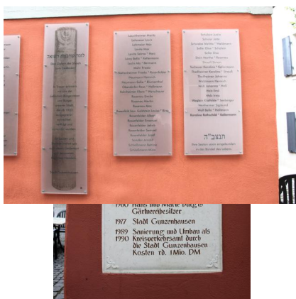
Gunzenhausen, Hafnermarkt 13, jüdisches Wohnhaus erb. 1753 von Kappel Samson, später Schächterhaus mit Mikwe von 1883, jetzt Kreisverkehrsamt mit Denk- und Mahnmal (Aufnahme 2022).