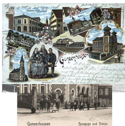
Gunzenhausen, Synagoge und Schule am Hafnermarkt (Aufnahme 1907).