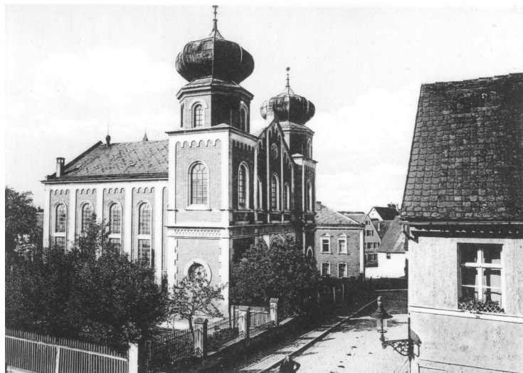
Gunzenhausen, Synagoge und Schule am Hafnermarkt (Aufnahme 1907).

Über eine mittelalterliche Synagoge in Gunzenhausen ist nichts bekannt. Erst 1583 wird eine „Judenschul“ erwähnt, dann wieder 1602. Ob es sich um dieselbe Synagoge handelte, die in der heutigen Waagstraße 1 stand und regelmäßig im 17. Jahrhundert durch Rechnungen des Bürgermeisteramtserwähnt wird, ist unklar. Dieses Gotteshaus wurde jedenfalls im Jahr 1700 für einen Neubau abgebrochen, weil sie die stetig größer werdende Schar der Gläubigen nicht mehr fassen konnte. Während der Baumaßnahmen mussten die Gottesdienste in einem Privathaus der „Judengasse“ (heute wahrscheinlich Waagstraße 3) stattfinden.