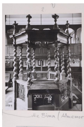
Innenansicht der Synagoge Ansbach.