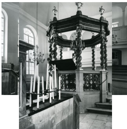
Innenansicht der Synagoge in Ansbach.