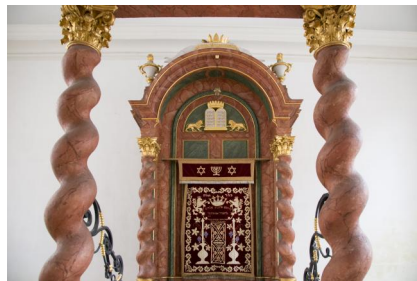
Synagoge Ansbach, innenansicht. Copyright Alexander Biernoth, Ansbach