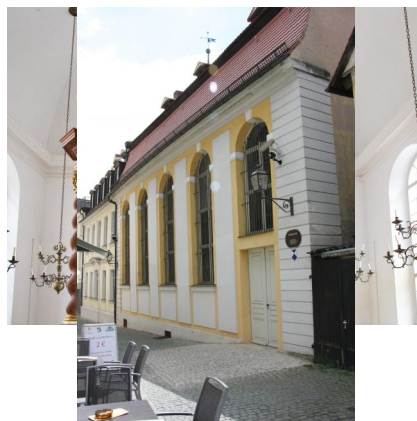
Synagoge Ansbach, innenansicht. Copyright Alexander Biernoth, Ansbach