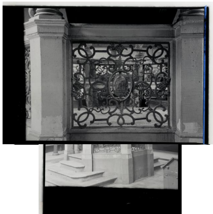
Synagoge Ansbach.