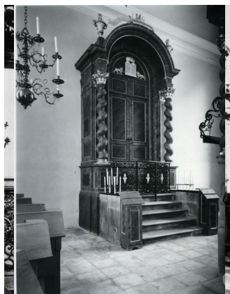
Die ehemalige Synagoge Ansbach. Blick auf Toraschrein und Almemor. Über dem Schrein ist die Inschrift zu sehen: "Wisse vor wem du stehst."