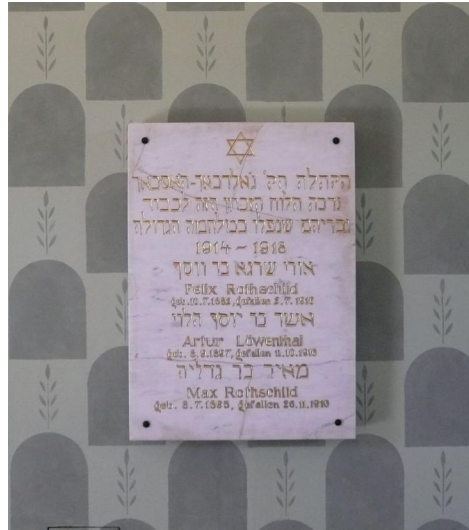
Kriegergedenktafel aus der Goldbacher Synagoge (Aufnahme 2012). Heute im Taharahaushaus des jüdischen Altstadtfriedhofs Aschaffenburg.

In Goldbach besteht ein Kriegerdenkmal, das die Gemeinde den Gefallenen 1922 errichtete. Das Denkmal, ein schlichter Rundtempel, befindet sich an der Seite der St. Nikolaus-Kirche in der Dorfmitte und ist mit dem Kirchenbau durch einen Bogen verbunden. Auf fünf Tafeln stehen die Namen der Gefallenen mit dem Todestag. Unter der Jahreszahl 1916 auch die der beiden jüdischen deutschen Soldaten: