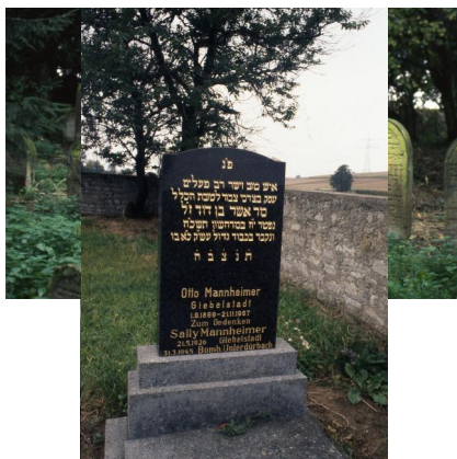
Jüdischer Friedhof von Allersheim.