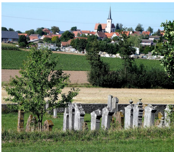
Allersheim, jüdischer Friedhof außerhalb des Ortes (Aufnahme 2012).