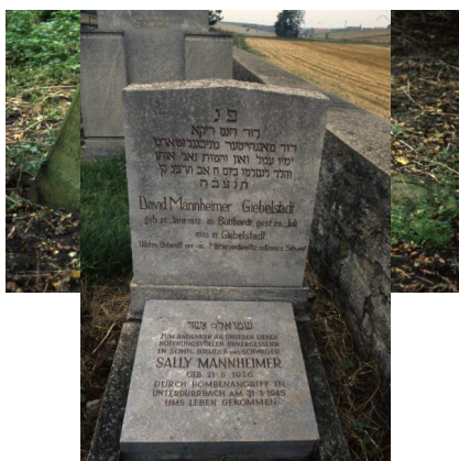
Jüdischer Friedhof von Allersheim.