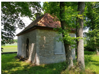
Allersheim, jüdischer Friedhof, Blick in das ehem. Taharahaus (Aufnahme 2004).