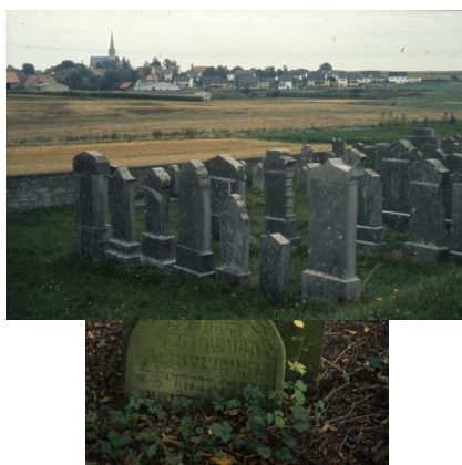
Jüdischer Friedhof von Allersheim.