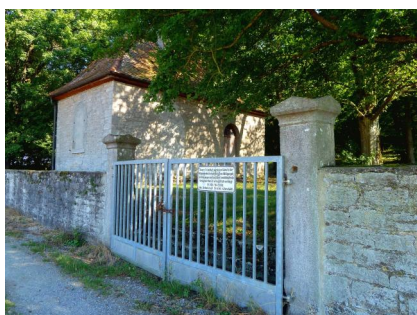
Allersheim, jüdischer Friedhof außerhalb des Ortes (Aufnahme 2012).