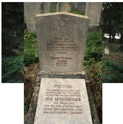
Jüdischer Friedhof von Allersheim.