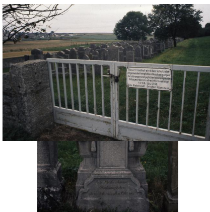
Jüdischer Friedhof von Allersheim.