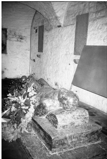
Gerolzhofen, Gedenkstätte für die Gefallenen beider Weltkriege.

Die Gedenkstätte für die Gefallenen beider Weltkriege befindet sich in der Stadt Gerolzhofen neben der Stadtpfarrkirche in der Krypta der Johanniskapelle, dem historischen Beinhaus, heute das Museum "Kunst und Geist der Gotik".