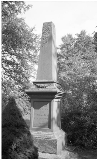
Georgensgmünd, Kriegerdenkmal 1806-14, 1813/14, 1866 und 1870/71 an der Rezatbrücke (Aufnahme Israel Schwier, 1996). Copyright BayHStA, BS N 80 80/92-13A

In Georgensgmünd zeugen heute zwei nahe beieinander liegende Denkmäler an der Rezatbrücke von der Opferbereitschaft und dem Sterben jüdischer deutscher Soldaten.