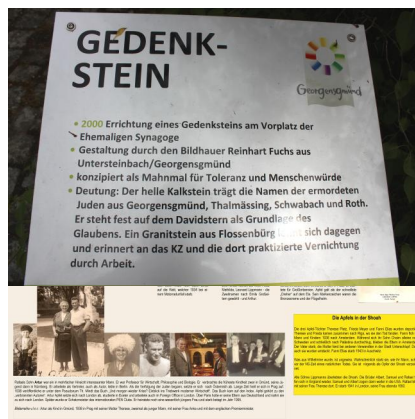
Die Lebensgeschichten der Mitglieder der Familie Apfel aus Georgensgmünd