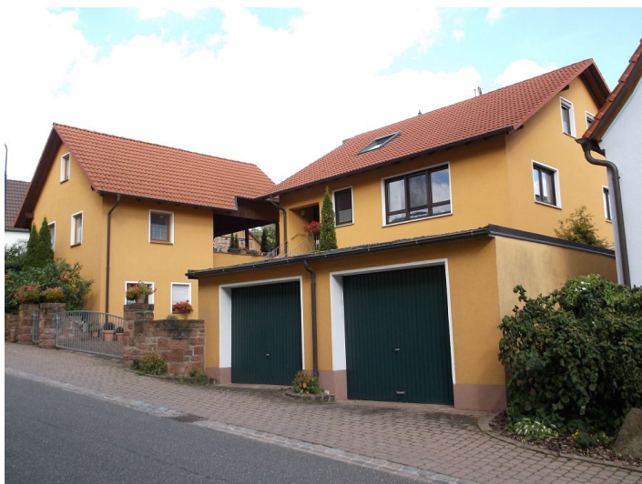
Der Standort der ehemaligen Synagoge Adelsdorf. Die Synagogenreste wurden 1951/52 abgetragen und das Grundstück neu bebaut.

Nur im Zusammenhang mit dem Neubau des jüdischen Gotteshauses im Jahr 1775 ist von einem früheren Gebets- und Unterrichtsraum die Rede, der sich vermutlich außerhalb des Gutshofs befunden hatte. Anstelle des abgerissenen mittelalterlichen Amtshofes an der Südwestecke des Burghofs entstand mit Genehmigung der fürstbischöflichen Behörden eine neue Synagoge. Die Kosten für den Rohbau übernahm der Freiherr von Drachsdorf. Die Synagoge blieb mit dem jüdischen Wohnkomplex verbunden. Im Erdgeschoss befanden sich drei Wohneinheiten mit Küche, Kammer und Stube und einem Zugang zum Back- und Waschhaus, im Obergeschoss der Bet- und Schulraum sowie zwei größere Wohnungen.