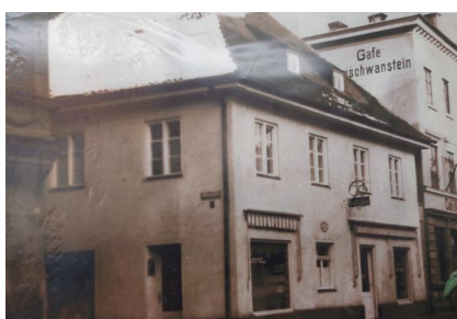
Freising, Bahnhofstraße, Hotel und Gaststätte "Zur Gred" (Aufnahme 2023).