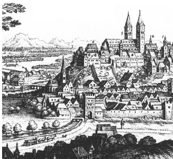
Freising "gen Mitternacht" (von Norden aus gesehen), Matthias Merian 1665. Am linken Rand der Stadtbefestigung steht das Landshuter bzw. Murn- oder "Judentor" (Nr. 22). Merian nannte es "Mohrenthor", wohl ein Missverständnis aufgrund des Bistumswappens, das ein gekröntes Mohrenhaupt zeigt.

Juden in Freising wurden 1214 erstmals urkundlich erwähnt. Zeitgenössische Quellen geben Hinweise, dass bis zu den Pestpogromen 1348/49 im Süden der Stadt – vor dem 1878 abgebrochenen Münchner Tor – ein jüdischer Eruv existierte, also ein in sich geschlossener Baukomplex, der Schutz bot und gleichzeitig die Einhaltung der Schabbatregeln erleichterte (heute der Häuserblock um Bahnhofstraße / Am Wörth). Ein Seitenarm der Moosach fließt durch dieses Areal und hätte eine Mikwe versorgen können. Entsprechende Bodenfunde wurden bislang jedoch nicht gemacht. Noch im frühen 19. Jahrhundert soll es in der Klosterhofmark Weihenstephan-Vötting den sehr alten Flurnamen "Judengarten" gegeben haben, der womöglich an eine Begräbnisstätte erinnerte.