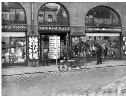
Freising, Kaufhaus Holzer (Obere Hauptstraße 9). Aufnahme von Franz Röss, 1903. Copyright Stadtarchiv Freising, Fotosammlung

Freising, Domberg, Grabplatte des Domherrn Konrad Tölkner (+1397) im Kreuzgang östlich des Freisinger Doms. Das Wappen mit der mausender Katze war laut Rudolf Goerge der Ursprung des angeblichen Spotreims um die "Freisinger Judensau".