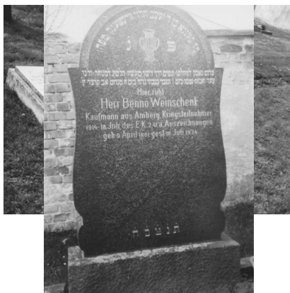
Jüdischer Friedhof Amberg.