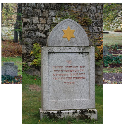
Ehrenfriedhof KZ-Gedenkstätte Flossenbürg, 2019. &nbsp;nbsp;nbsp; Copyright KZ-Gedenkstätte Flossenbürg (Foto: Thomas Dashuber)

Größe: Der Friedhof umfasst 120 Gräber für Gefangene des Konzentrationslagers Flossenbürg, die nach ihrer Befreiung im April 1945 an den Folgen der Haft starben. Die US-Militärregierung verpflichtete alle Einwohner Flossenbürgs, an den Bestattungen teilzunehmen. Jedes Grab ist namentlich gekennzeichnet.