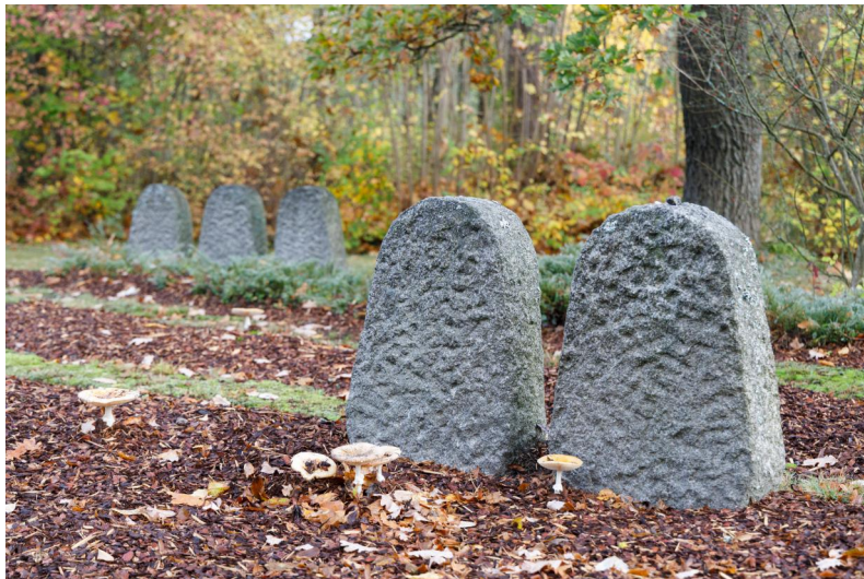
Ehrenfriedhof KZ-Gedenkstätte Flossenbürg, 2019. &nbsp; ; Copyright KZ-Gedenkstätte Flossenbürg (Foto: Thomas Dashuber)

In Flossenbürg befinden sich ein KZ-Friedhof auf dem Gelände der KZ-Gedenkstätte und ein KZ-Friedhof im Dorf Flossenbürg am Fuß des Schlossbergs.