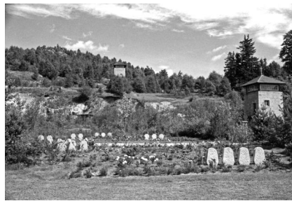
Ehrenfriedhof KZ-Gedenkstätte Flossenbürg, um 1960