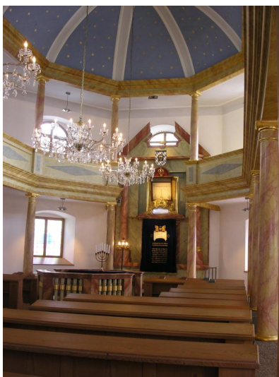
Synagoge in Floß. 1964 erwarb der Landesverband der Israelitischen Kultusgemeinden in Bayern das Gebäude. 1971 wurde die Synagoge restauriert. Am 9. November 1980 fand die Einweihung statt. Von 2000 bis 2005 stand eine erneute umfassende Sanierung des Gebäudes an. Am 16. Oktober 2005 erfolgte eine Neueinweihung.