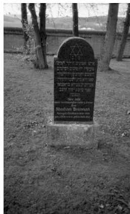
Fischach, Grabstein des Kriegsteilnehmers Abraham Bravmann auf dem jüdischen Friedhof.