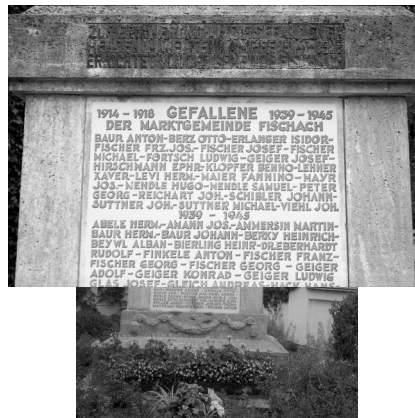
Fischach, Mahn- und Denkmal auf dem jüdischen Friedhof, Rückseite mit den Namen der Gefallenen des Ersten Weltkriegs (Aufnahme Israel Schwierz, 1996). Copyright BayHStA, BS N 80 80/94-23