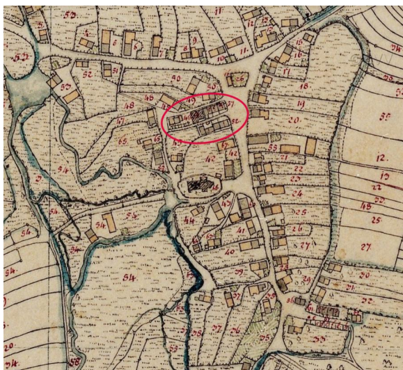
Fischach, Uraufnahme 1808-1864 (Ausschnitt). Der "Judenhof" mit Synagoge ist rot markiert.

Fischach war seit dem Beginn des 14. Jahrhunderts bis 1805 Teil der habsburgischen Markgrafschaft Burgau. Mit dem Ziel, ihre Territorialpolitik auszubauen und ihre Einnahmequellen zu vergrößern, siedelten die Habsburger seit dem 16. Jahrhundert systematisch jüdische schutzpflichtige jüdische Grunduntertanen an. Erste Familien werden in der zweiten Hälfte des 16. Jahrhunderts nachweisbar. 1582 werden sechs Schutzjuden aufgezählt, 1586 regelte ein Weidevertrag die Nutzungsrechte für das Fischacher Weideland, wobei auch die jüdischen Viehhändler gegen Zahlung das gemeindliche Weideland nutzen konnten. Aufgrund religiöser Vorbehalte der katholischen Geistlichkeit und aus wirtschaftlichen Interessen kam es immer wieder zu Streit.