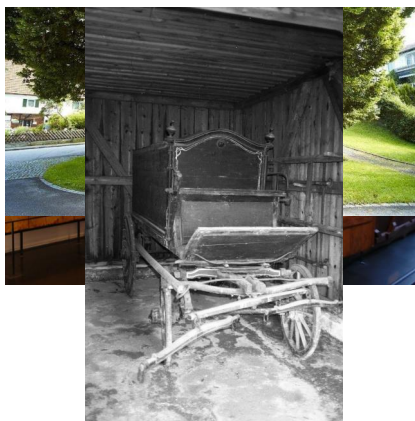
In der heutigen Triebgasse bei der Thoma-Linde erinnert seit 1999 ein Gedenkstein an die ehemaligen jüdischen Mitbürger Fischachs.