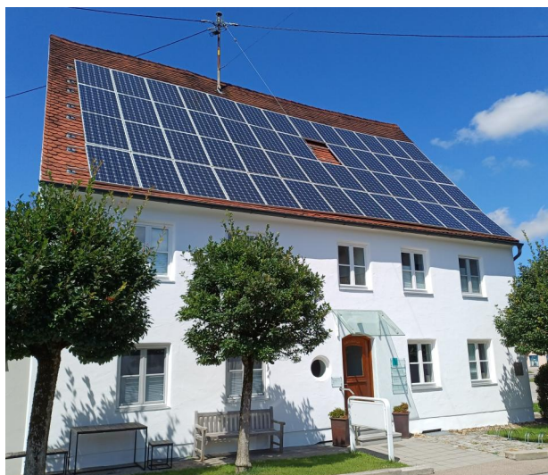
Fischach, Am Judenhof 4, ehemalige Synagoge mit Gedenktafel (Aufnahme 2024).

Ein erster Betraum aus der zweiten Hälfte des 17. Jahrhunderts wird in einem Wohnhaus (wahrscheinlich Am Judenhof 2) vermutet. Aus diesem Gotteshaus stammt wohl der Parochet, den Theodor Harburger 1927 fotografierte und der in das Jahr 1719 datiert ist (heute im Israel Museum Jerusalem). Seit 1728 bemühte sich die Gemeinde um den Bau einer eigenen Synagoge. 1739 verkaufte Simon Mendle einen rund 210 m 2 großen Bauplatz, der neben seinem Haus angrenzte (Am Judenhof 4). Das Augsburger Domkapitel gab nur widerwillig und mit Einschränkungen seine Zustimmung für das Bauvorhaben. Im Vergleich mit der am 30. Oktober 1739 eingeweihten Synagoge bezeichnete der katholische Ortspfarrer seine eigene Kirche verärgert als "Stadel".