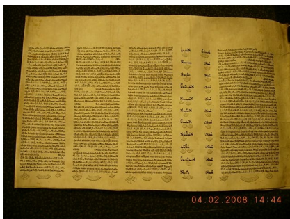
Am 15. November 1938 kam es zur Zerstörung und Schändung der Fischacher Synagoge. Eine Esther-Rolle konnte gerettet werden. Sie befindet sich heute im Besitz der Gemeinde Fischach.