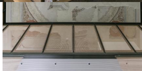
Innenansicht der ehemaligen Synagoge Fellheim.