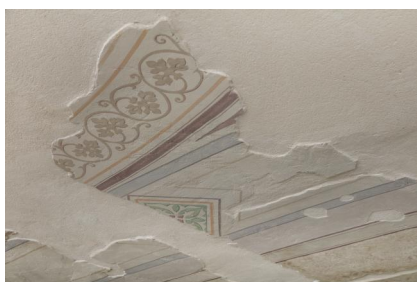
Innenansicht der ehemaligen Synagoge Fellheim.