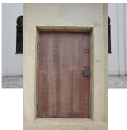
Fellheim, Memminger Str. 17, ehem. Synagoge und Gedenkort (Aufnahme 2021).