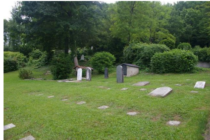
Ansichten des Jüdischen Friedhofs der DP-Gemeinde in Feldafing.