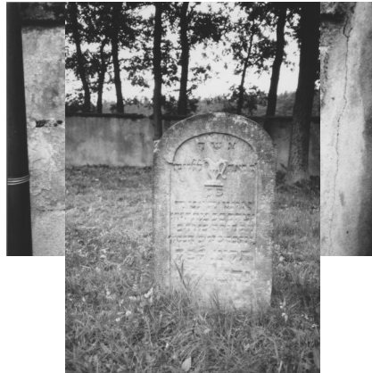
Jüdischer Friedhof Ermershausen.