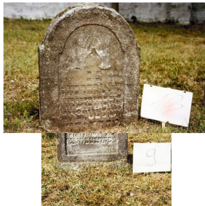
Jüdischer Friedhof Ermershausen.