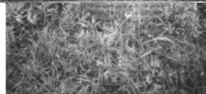
Jüdischer Friedhof Ermershausen.