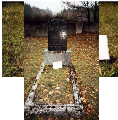
Jüdischer Friedhof Ermershausen.