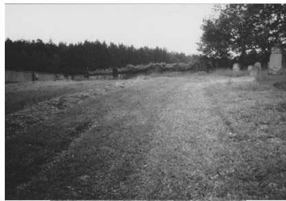
Jüdischer Friedhof Ermershausen.