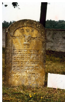
Jüdischer Friedhof Ermershausen.