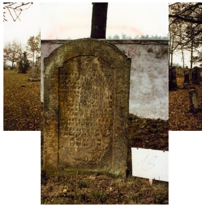
Jüdischer Friedhof Ermershausen.