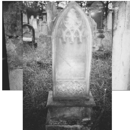
Jüdischer Friedhof Ermershausen.