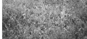
Jüdischer Friedhof Ermershausen.