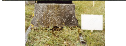
Jüdischer Friedhof Ermershausen.