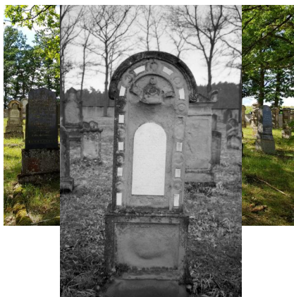
Jüdischer Friedhof Ermershausen; Drohneneinsatz zur Anfertigung von Fotos, 2020.