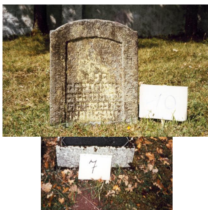
Jüdischer Friedhof Ermershausen.