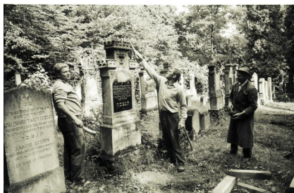
Der jüdische Friedhof in Erlangen an der Nordseite des Burgbergs, 1968. (VIII.11311.N.4/5, VIII.11311.N.4/1, VIII.11311.N.4/2)