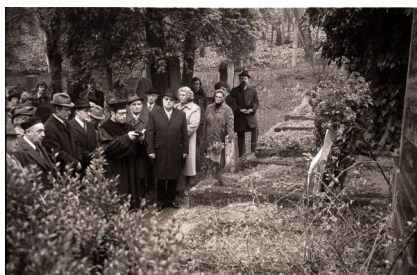
Gedenkfeier und Kranzniederlegung auf dem jüdischen Friedhof am Burgberg anlässlich seines 100jährigen Bestehens, 1991. Copyright Stadtarchiv Erlangen (VIII.10589.N.1/21)