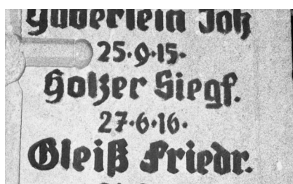
Ermetzhofen, Kommunales Kriegerdenkmal, Detail mit dem Namen von Siegfried Holzer (Aufnahme 1996). Copyright BayHStA, BS N 80 80/113-12A

Das Kriegerdenkmal von Ermetzhofen für die Gefallenen beider Weltkriege befindet sich rechts vor dem Eingang zum örtlichen Friedhof an der Straße nach Uffenheim. Unter einem Reichsadler und Stahlhelm sowie der Inschrift Die Gemeinde Ermetzhofen in Dankbarkeit ihren tapferen Helden gefallen im Weltkrieg 1914 – 1918 sind die Namen der Gefallenen aufgelistet, darunter auch der des jüdischen deutschen Soldaten HOLZER SIEGF[RIED] 27.6.16.