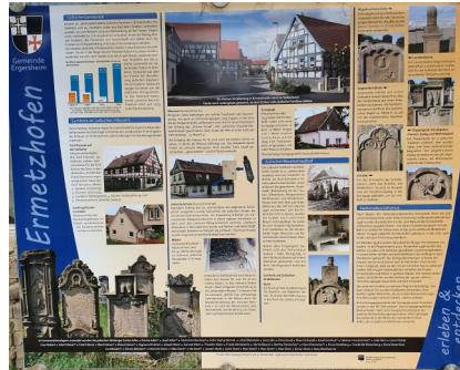
Ermetzhofen, Gedenk- und Infotafel zum jüdischen Leben des Ortes (Detail-Aufnahme 2023).