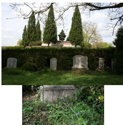
KZ-Friedhof und Gedenkstätte St. Ottilien.