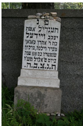
KZ-Friedhof und Gedenkstätte St. Ottilien.