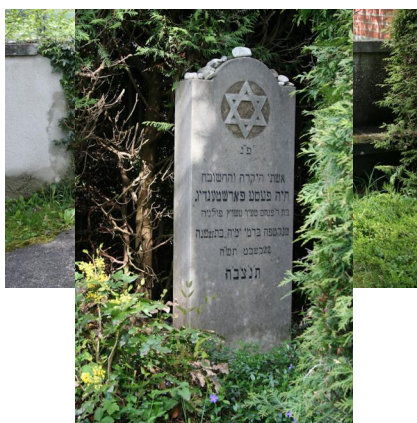
KZ-Friedhof und Gedenkstätte St. Ottilien.