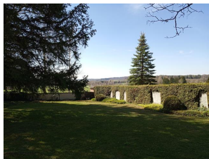
KZ-Friedhof und Gedenkstätte St. Ottilien.