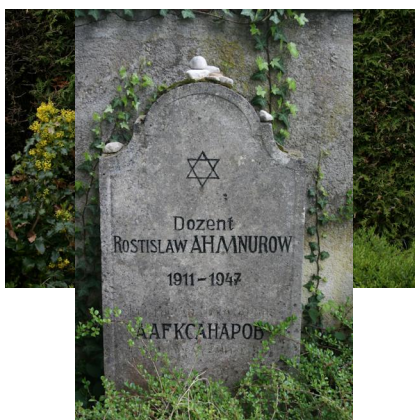
KZ-Friedhof und Gedenkstätte St. Ottilien.