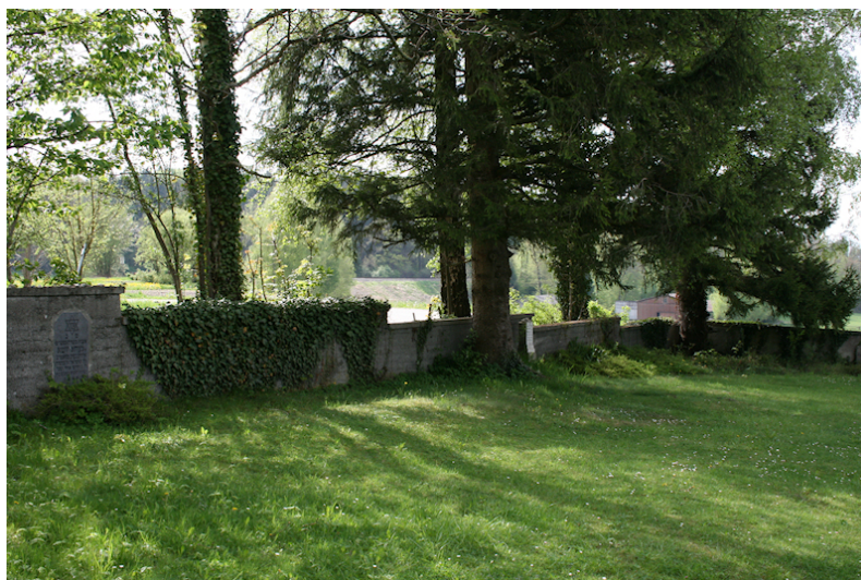
KZ-Friedhof und Gedenkstätte St. Ottilien.

Der KZ-Friedhof liegt am Ortsende von St. Ottilien kurz vor dem Bahngleis neben dem Klosterfriedhof. Der Friedhof birgt Opfer aus dem gesamten Lagerkomplex Landsberg / Kaufering, die nach der Befreiung der Lager in das im Kloster eingerichtete Jüdische Krankenhaus gebracht worden waren.