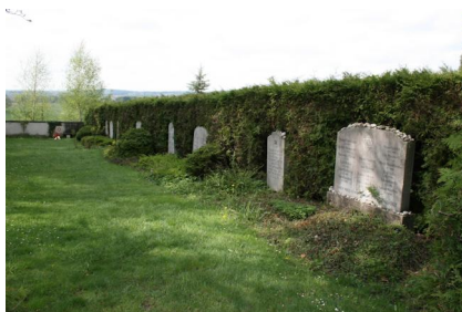
KZ-Friedhof und Gedenkstätte St. Ottilien.

(Dank an Jim G. Tobias https://www.nurinst.org für Informationen)