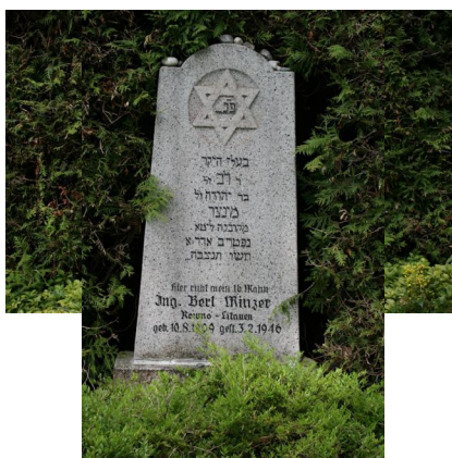
KZ-Friedhof und Gedenkstätte St. Ottilien.