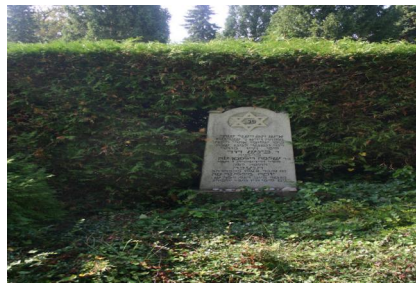
KZ-Friedhof und Gedenkstätte St. Ottilien.