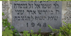
KZ-Friedhof und Gedenkstätte St. Ottilien.