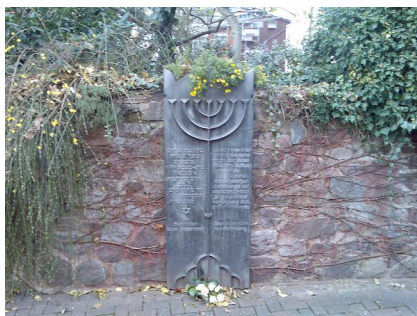
Denkmal zur Erinnerung an die ehemalige Synagoge Alzenau