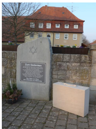
Ebelsbach, Standort der ehem. Synagoge am Judenhof, kommunales Mahnmal für die jüdische Gemeinde, daneben Kofferdenkmal von DenkOrt Deportationen (Aufnahme 2019).