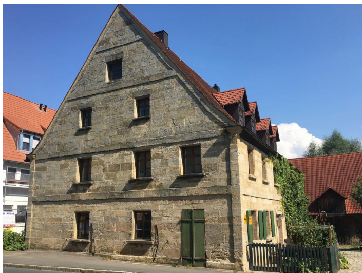
Ehemaliges jüdisches Wohnhaus, zweigeschossiger giebelständiger Sandsteinquaderbau mit Satteldach, 1. Hälfte 19. Jh.; aufgeführt im Bayerischen Denkmal-Atlas.

Eine Ansiedelung jüdischer Familien ist in Dormitz erst zu Beginn des 17. Jahrhunderts gesichert: 1603 wird ein "Jud David" genannt, der sein neu erbautes Haus wegen fehlender Genehmigungen wieder einreißen musste, und 1611 sind sechs jüdische Häuser belegt. Nach 1720 wurden die Verstorbenen der Dormitzer Gemeinde auf dem jüdischen Friedhof in Baiersdorf bestattet. Spätestens im 18. Jahrhundert etablierte sich eine kleine Gemeinde, da 1728 sechs und 1771 bereits zehn Familien gezählt wurden.