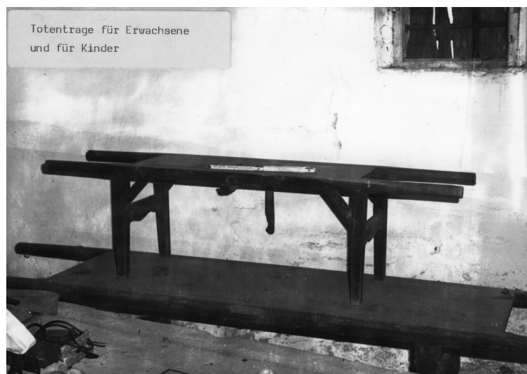
Diespeck, Jüdischer Friedhof, Totentrage für Erwachsene und für Kinder.

In Diespeck führen die ersten Spuren jüdischen Lebens bis in das 17. Jahrhundert. 1616 wird ein jüdischer Hausbesitzer am Ort genannt. 1709 wurden neun jüdische Familien gezählt, 1729 21 und 1771 27 Familien. Diese Zahlen lassen für das 18. Jahrhundert auf eine stabile Gemeindeentwicklung schließen. Ob es zu dieser Zeit bereits Gemeindeeinrichtungen wie z.B. eine Schule gab, ist nur zu vermuten. Diespeck gehörte bis 1792 zur Markgrafschaft Ansbach-Bayreuth, dann kurzzeitig zum Königreich Preußen, bis es endgültig an Bayern fiel. Bereits 1786 hatte die jüdische Gemeinde auf einer Anhöhe außerhalb von Diespeck einen Friedhof angelegt.